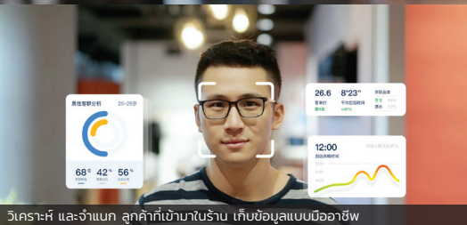
วิเคราะห์ และจำแนก ลูกค้าที่เข้ามาในร้าน เก็บข้อมูลแบบเรียลไทม์