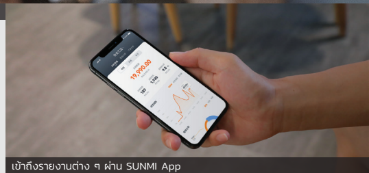
เข้าถึงรายงานต่าง ๆ ผ่าน SUNMI App