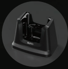
SUNMI L2K แท่นชาร์จ (อุปกรณ์เสริม)