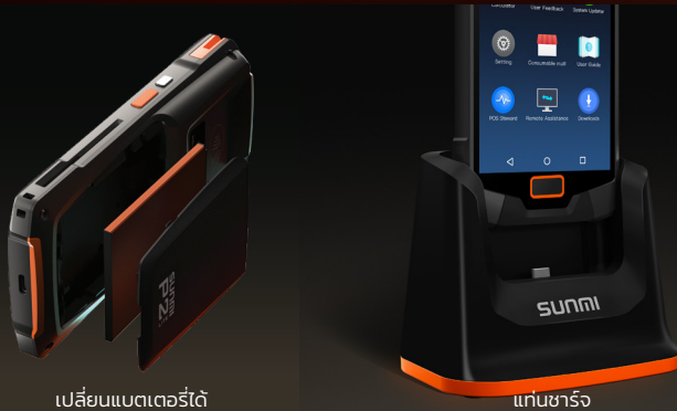
เปลี่ยนแบตเตอรี่ได้